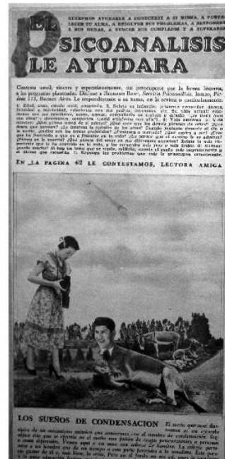
Los Sueños de Condensación Idilio N° 60 – Enero de 1950