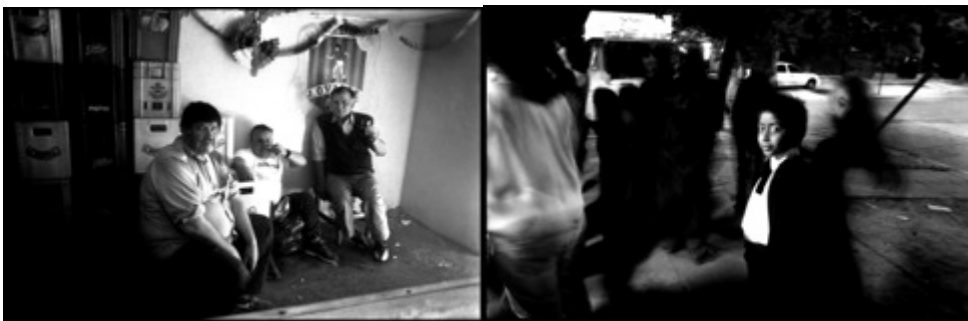
Ilustración 9 Miguel Navarro. Sin título 2010

Miguel Navarro configura la privacidad biográfica del barrio en que vive, donde los protagonistas son el espejo de situaciones ajenas del flujo exacerbado de la sociedad. La serie representa un álbum familiar visual contemporáneo.