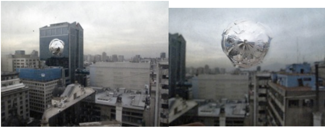
Ilustración 12 Prem Sarjo. Santiago 2010

Kurt Petautschning, desde la postransición, reflexiona sobre los grandes y pequeños patrimonios; los restos como huellas de la memoria: el Estadio Nacional y los objetos de personas desaparecidas. Desde lo privado y lo público busca resignificar e instalar aquello que no está y se debe recordar, ya sea desde la institución o la esfera privada. La memoria como signo de permanencia de existencia opera en todos los casos, utilizando diversos soportes: fotografía, video, narración en primera o tercera persona.