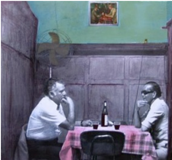
Ilustración 1 Leonora Vicuña. El Cabildo. Santiago 1982

Leonora Vicuña nos presenta un mundo privado, íntimo donde los protagonistas son personajes bohemios, espacios comunes al santiaguino como lo eran los bares y retratos de personas que transitaban en las calles, bares o en las casas, Vicuña nos configura una ciudad oculta en un periodo de contenciones políticas y culturales, en la cual ella traza identidades simbólicas no entendidas en la época. Por otro lado, sus fotografías son atemporales, están suspendidas en el tiempo.