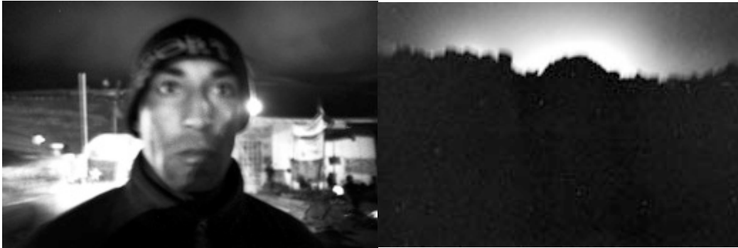
Ilustración 5 Nicolás Wormull. Rescate de los mineros 2010

profesionales y amateurs, lo que negó ver/observar momentos y sucesos diarios fuera de la contingencia.