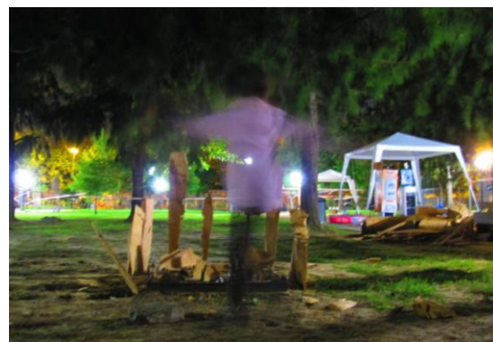
Una niña, sensibilizada, realizó su escultura-instalación en la plaza.