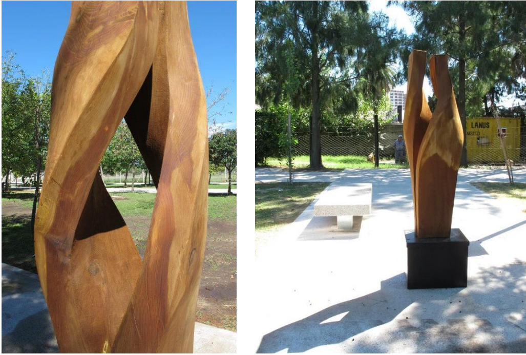
Raúl Varnerín (Buenos Aires), “Esperanza”, madera de ciprés, 150 cm. altura x 45 cm x 30 cm.

Lejos de todo intento intelectual, Raúl Varnerín talló sensiblemente el ciprés, su objetivo: transmitir esperanza con sus formas sensuales y alabeadas que dibujan un espacio interno que cobija, preserva y cuida el futuro.