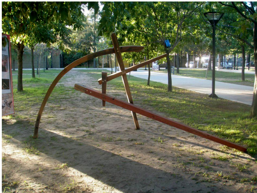
Yamila Cartannillica (Avellaneda), “Construcción colectiva”, durmientes, 180 cm de altura x 340 cm x 130 cm.

Yamila Cartannillica transformó pesados y texturados durmientes de eucalipto en lisas formas lineales de madera. Así genera una estructura espacial y dinámica que pareciera mostrar la danza de un “colectivo” –por cierto humano– al compás de un ritmo musical. La inestabilidad siempre en base a diagonales, desniveles, equilibrios circunstanciales, que le da un carácter ingrávito.