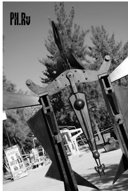
Oscar de Bueno (C.A.B.A.), “Portal para el descanso del guerrero”, hierro y acero, 315 cm de altura x 210 cm x 140 cm.