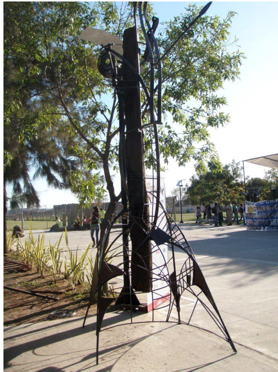
Sandro Lucera Pires (Brasil), “El arquero de los sueños perdidos”, hierro y quebracho, 390 cm de altura x 240 cm x 150 cm.

El constructivismo y la monumentalidad están presentes en las obras de Oscar Stáffora y Oscar de Bueno.