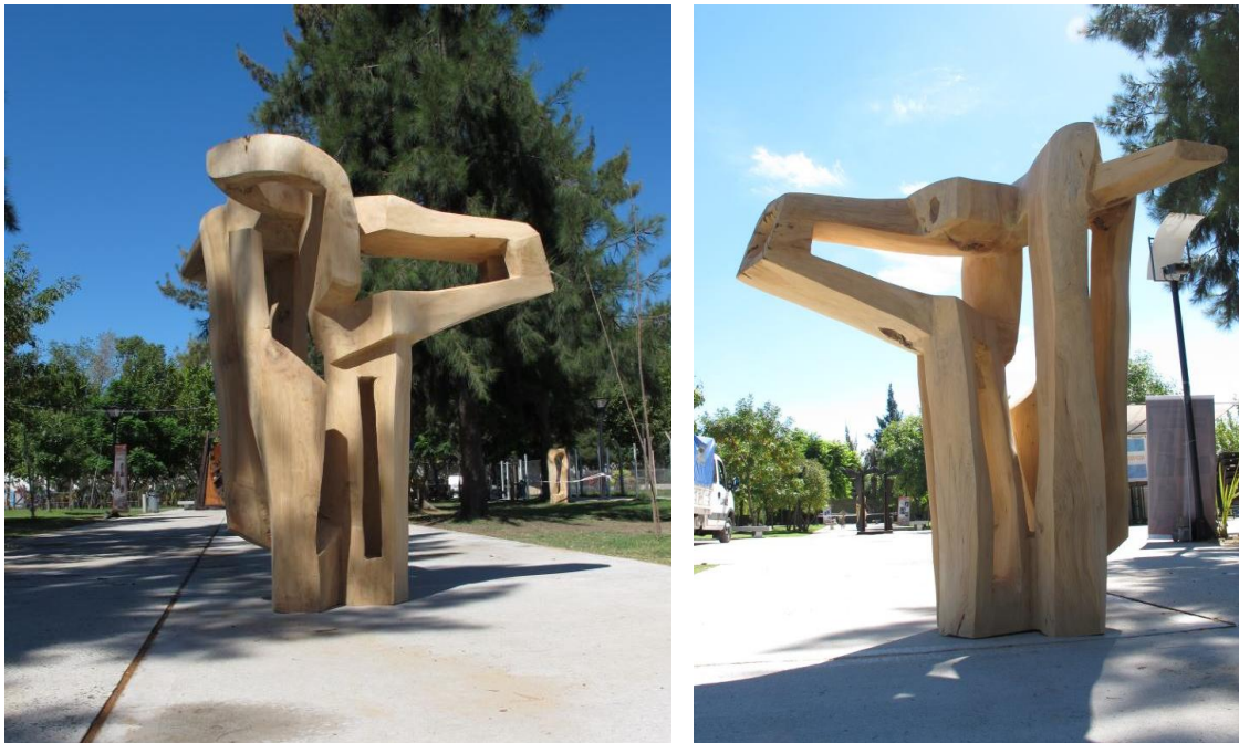
Matías Noguera e Isabel Arriaga Pozo (Chile), “Contrapeso social”, madera de ciprés, 200 cm altura x 120 cm x 170 cm.

Matías Noguera e Isabel Arriaga Pozo con firme decisión trabajaron con motosierra y oradaron un tronco de gran porte de ciprés con ramas, con mucho aliento generaron sutiles formas externas e internas donde la contraposición de masa y espacio es alegoría del contrapeso social.