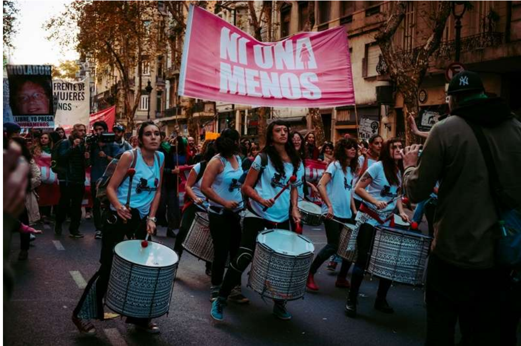
*Movilización Ni una menos del 3 de junio de 2016.