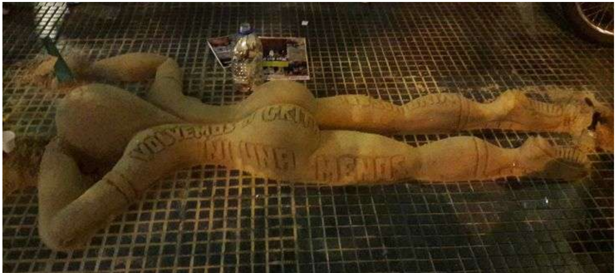
Ni una menos – Escultura realizada con arena, carton, arcilla. Lugar Avenida de Mayo 18 de septiembre de 2016.