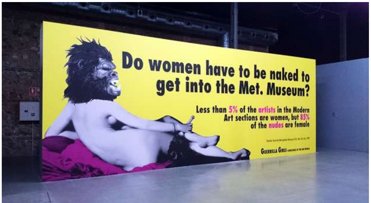
Guerrilla Girls: intervención en museos y espacios públicos de Manhattan.