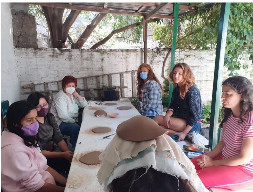
Alfarería situada y artesanal. Asociación de Fomento Gral. Paz. Villa Lugano. Comuna 8. Caba. 2021

Hemos abierto a fines del 2021 en la Asociación de Fomento General Paz, en Villa Lugano de la Comuna 8, el Taller Brumbrúm de alfarería situada y artesanal, brindando espacios para nuestra alfarería. Expandiendo el propio hacer y su relación histórico social con el entorno. Este año 2022, comenzamos un ciclo de taller gratuito gracias al apoyo del Fondo Nacional de las Artes. Con la intención de seguir construyendo colectivamente entre hermanxs y compartir experiencias. Sabemos por oralidad, que ancestralmente los trabajos de alfarería eran hechos por toda la comunidad, estas prácticas fueron siempre un bien común y compartido.