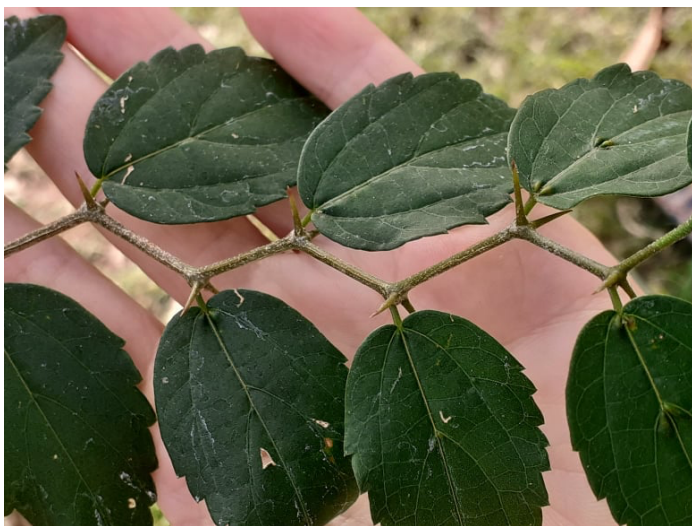
Ramita del árbol Tala. 2020

grupo de lingüistas a quienes valoramos y estimamos muchísimo, y cuando sea el momento indicado podremos difundir y publicar. Así mismo como todos nuestros saberes y trabajos ancestrales en piedra, tejidos, cueros, herramientas diversas, como las lahi deti 20 , Afia 21 , quilla 22 , y las comidas que están tan popularizadas que se desconoce su origen, lo más difundido es nuestra práctica chuhua ñapait 23 .