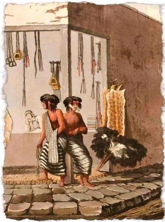
Pulpería La Banderita. Acuarela. Emeric Essex Vidal. 1800

Gran parte de nuestras familias han habitado en los mismos lugares desde todos los tiempos, el espacio que ancestralmente ocupó nuestro pueblo fue desde el territorio santafesino, que es el Río Carcarañá, hacia el oeste las sierras de San Luis, Córdoba, Río