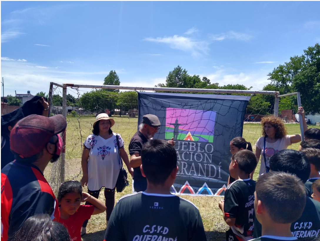
Club Social y Deportivo Defensores de Querandí. Ciudad Evita. Partido de La Matanza. Buenos Aires. 2021