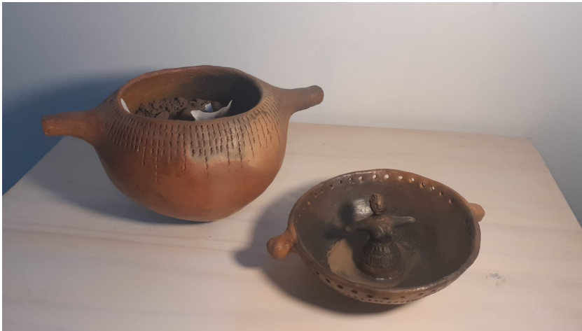
Olla ritual. Alfarería Querandí. Taller Brumbrúm. 2021