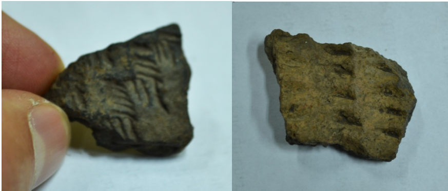
Cerámica arqueológica. Sitio La Noria. Villa Riachuelo. Comuna 8. Archivo grupo Barro Local. 2018