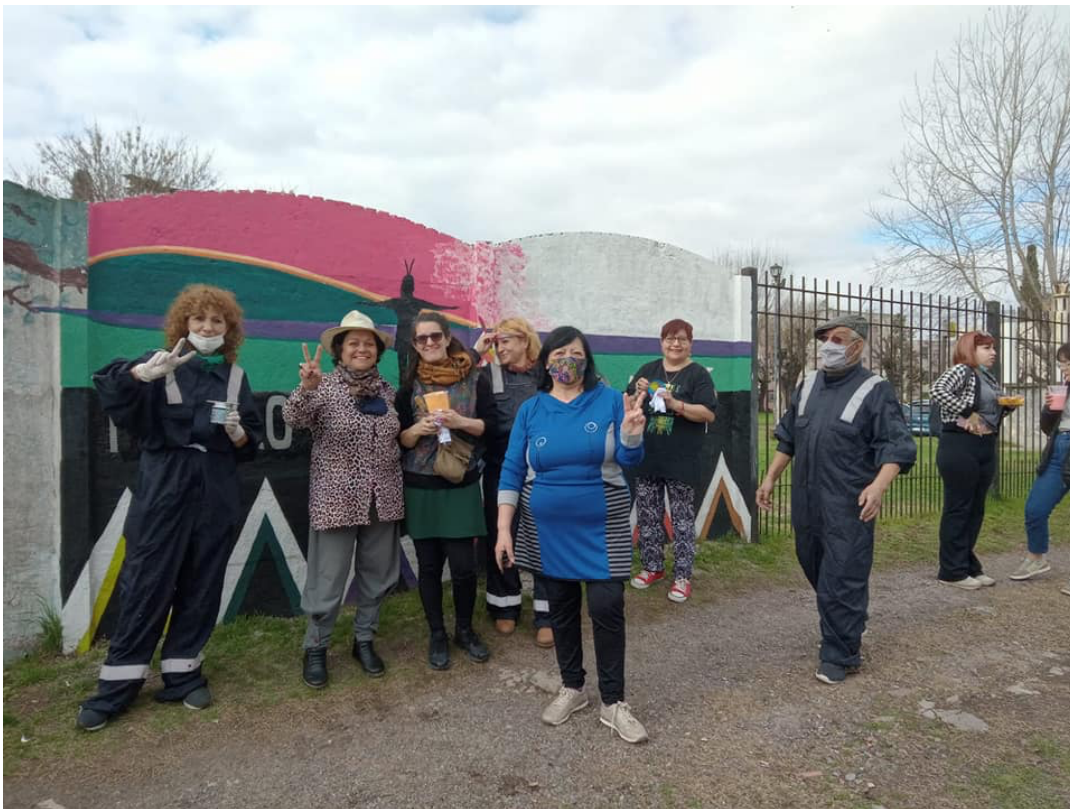
Nuestra Bandera. Muraleada. Club Social y Deportivo Defensores de Querandí. Ciudad Evita. La Matanza. Buenos Aires. 2021