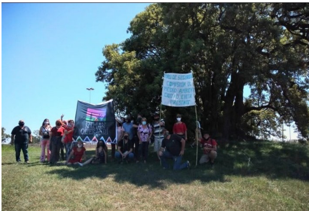
Tres Ombúes. Ciudad Evita. La Matanza. 20/02/2021