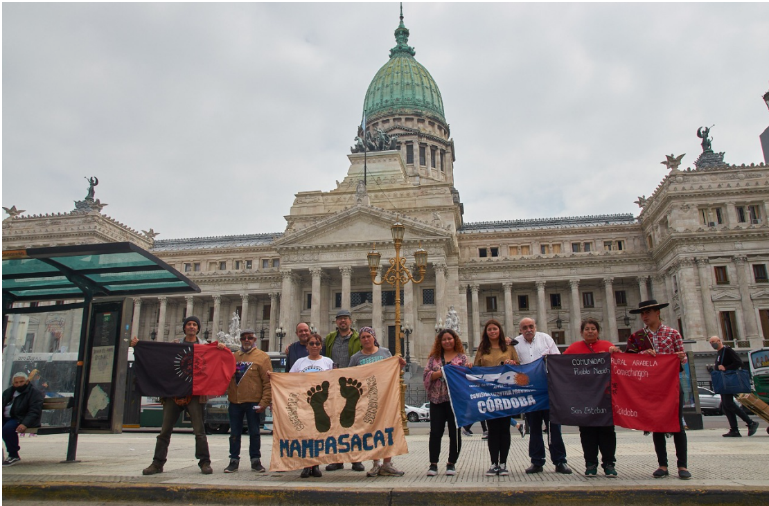
Congreso de Nación Argentina. Por la prórroga de la Ley 26.160. 2021