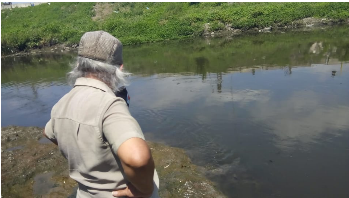
Rio Chuelo. Barrio José Hernández. La Salada. Partido de La Matanza. Buenos Aires. 2020

En la Cuenca Matanza-Riachuelo, dentro del Partido de La Matanza, en Ciudad Evita, prov. de Buenos Aires, está el Sitio que se nombró Ezeiza III, se lo conoce también por Sitio Tres Ombúes. Allí la problemática principal es que siendo una reserva histórica, natural y arqueológica no se la toma como tal. Las tierras fueron usurpadas para construcciones ilegales y negocios inmobiliarios. Existen muchas demandas y luchas de vecinxs y distintas organizaciones para proteger y recuperar el área, además de un proceso