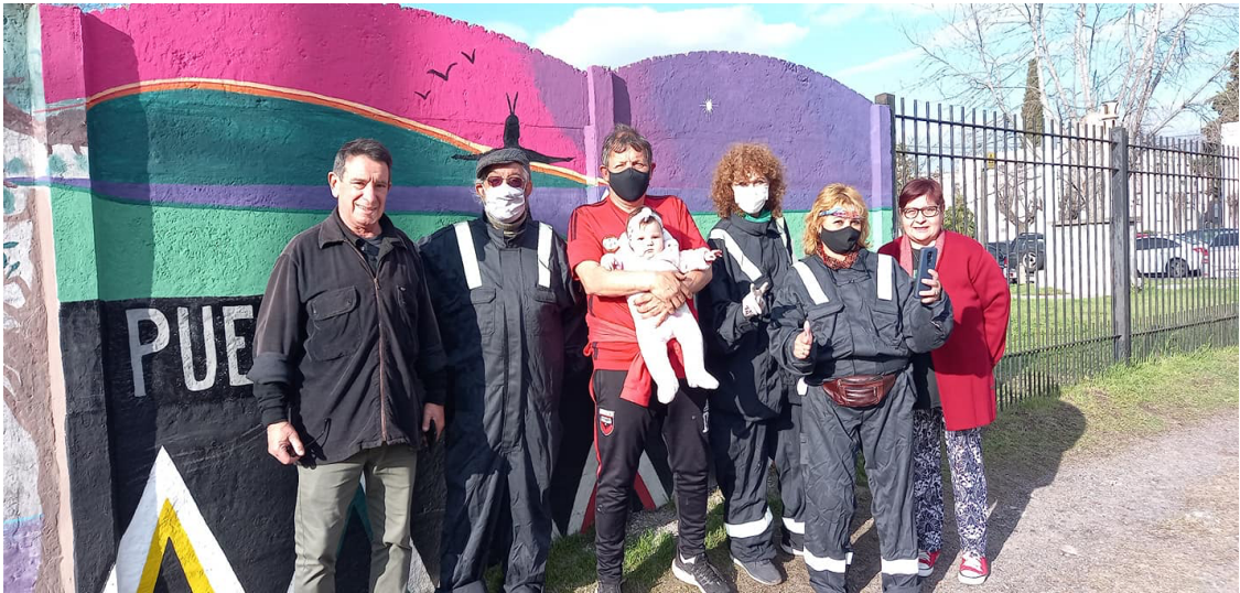
Nuestra Bandera. Muraleada. Club Social y Deportivo Defensores de Querandí. Ciudad Evita. La Matanza. Buenos Aires. 2021