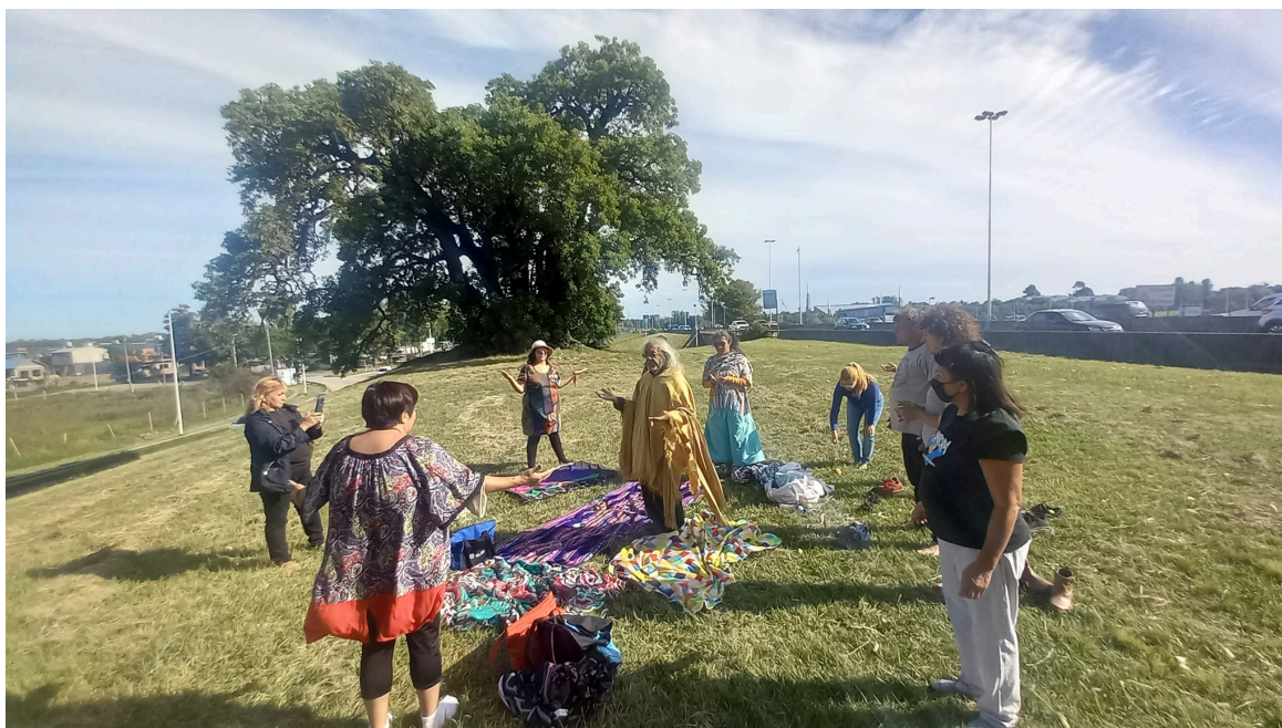
Tres Ombúes. Ciudad Evita. La Matanza. 20/02/2021

Estamos revitalizando saberes, mediante diversas activaciones en distintos ámbitos, que construyen narrativas identitarias. Estamos organizándonos, en la ciudad y provincia de Buenos Aires, pero también en La Pampa, Córdoba, San Luis, Santa Fe y otras provincias. Para que nuestros testimonios de vida, sean valorados y formen parte de la decolonización de la historia impoluta, con la que nos hemos formado en las épocas oscuras en Argentina y toda Latinoamérica. Es necesario abordar con énfasis trabajos en el territorio con la memoria, la verdad y la justicia. Desde nuestros orígenes prehispánicos, pasando por las distintas épocas de nuestras generaciones. Hoy estamos con proyectos de difusión, por un lado, hacia adentro de nuestras familias, con los relatos orales de las poderosas huellas de nuestrxs ancestrxs. Reconociéndonos en las flora y fauna autóctonas, mixturadas con el paisaje de la Buenos Aires cosmopolita. Llevamos la nostalgia de haber perdido tanto, pues el vaciamiento por la colonización dentro de lo que se puede ver en la historia incluso hasta en la posmodernidad, a través de los distintos gobiernos que tiene mucho que ver con las dictaduras que han sustentado prácticamente la primera época colonial. Y, por otro lado, trabajamos con proyectos en los ámbitos públicos. En la Legislatura de la